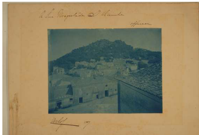
Cianotipia impressa e assinada por D. Carlos com dedicatória, 1889.

É de notar que vários membros da família real fotografavam, os álbuns contêm referências a muitos deles, com provas assinadas ou legendadas por D. Amélia. O príncipe D. Luís Filipe era um praticante assíduo, existindo vários conjuntos de fotografias em álbuns da sua autoria. O rei D. Carlos foi um fotógrafo interessado pelos diferentes processos fotográficos, a coleção inclui várias provas em platinotipia e cianotipia impressas e assinadas pelo rei, com o registo de informação técnica e opções tomadas durante a execução do processo, como o tempo de impressão e revelador.