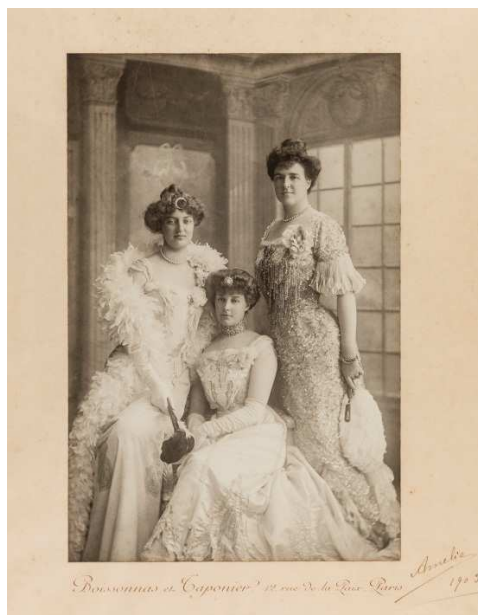
D. Amélia e suas irmãs, 1903.

Entre janeiro e junho de 2015 a LUPA colaborou com a Fundação Casa de Bragança na observação e inventariação da coleção de fotografia que se encontra no Paço ducal de Vila Viçosa. Foi produzido um inventário informatizado, que descreve todas as unidades de instalação da organização inicial e fotografias dispersas.