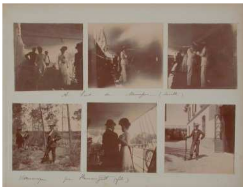
Página de álbum de D. Amélia

Esta coleção foi reunida pela família real durante o reinado de D. Carlos e D. Manuel II e teve um contributo significativo da rainha D. Amélia. Deixou-nos um legado fotográfico notável, com retratos de estúdio dos grandes fotógrafos portugueses e europeus da época, onde a rainha se deslocava frequentemente com os seus filhos, irmãs e família; deixou-nos fotografias da sua autoria e um conjunto de álbuns com fotografias pessoais e compilados pela rainha, com legendas, datas e anotações.