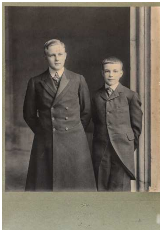
D. Luis Filipe e D. Manuel prova em platina de Knights Whittome.

dados ao nível da UI (unidade de instalação) num total de 1.493 unidades, o que permite o conhecimento da coleção, quer a nível físico quer em relação ao seu conteúdo e temáticas. O inventário agora terminado pela Lupa é assim mais um passo na preservação e utilização desta notável coleção.