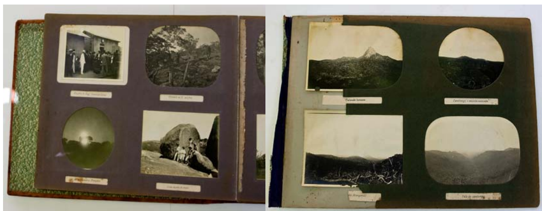
Páginas do álbum antes da intervenção

Em cada página estavam dispostas quatro provas fotográficas e respectivas legendas, resguardadas atrás de janelas de cartolina com formas variadas (circulares e rectangulares), que enquadravam e davam unidade ao conjunto. No entanto, estas janelas também impediam a leitura de uma parte significativa da imagem.