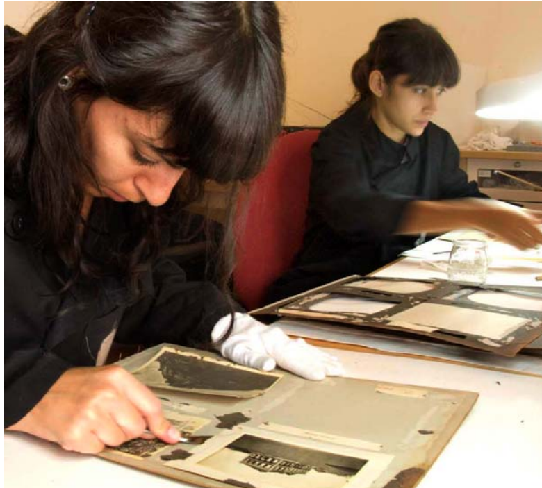
Remoção das provas das páginas originais do álbum

O projecto de intervenção foi definido no sentido de preservar todo o arranjo e forma de apresentação originais, substituindo todos os materiais nocivos e degradados por outros de boa qualidade e em bom estado. Para garantir a fidelidade na montagem do futuro álbum foi feito o registo fotográfico de todas páginas antes da intervenção.