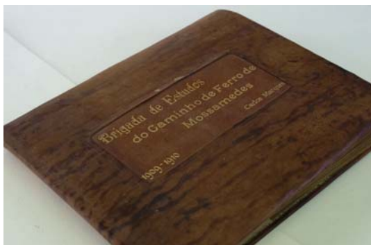
Capa antes da intervenção

O álbum Brigada de Estudos do Caminho-de-Ferro de Moçamedes data dos primeiros anos do século XX e foi realizado em Moçamedes, Angola. Nele se mostra a construção do caminho-de-ferro de Moçamedes desde o seu início, incluindo as diversas etapas de construção, os primeiros exploradores do terreno, as medições topográficas, as “salas de desenho” ao ar livre, as rotinas diárias dos exploradores, etc.