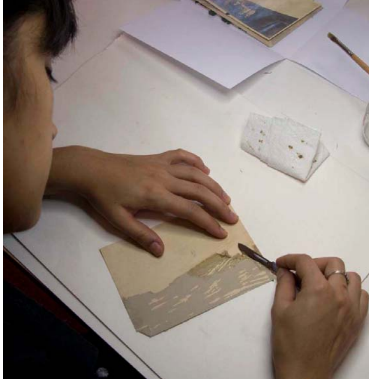
Remoção de colas do verso das provas

Depois de limpas e planificadas sob pesos, as provas foram submetidas a tratamentos de consolidação de rasgões e preenchimento de lacunas. Em algumas efectuou-se retoque pontual com aguarela, com vista a uma leitura coerente da imagem. Finalmente, todas as provas foram digitalizadas de forma a poderem ser consultadas por meios informáticos, tendo sido entregue ao proprietário uma reprodução completa do álbum em formato digital.